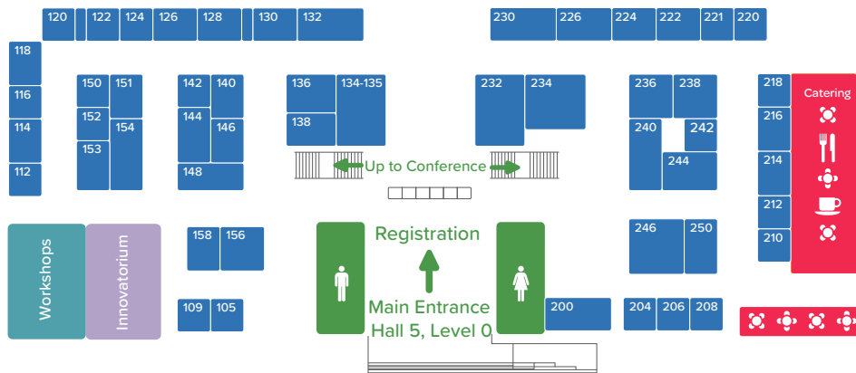
Hall 5, Level 0